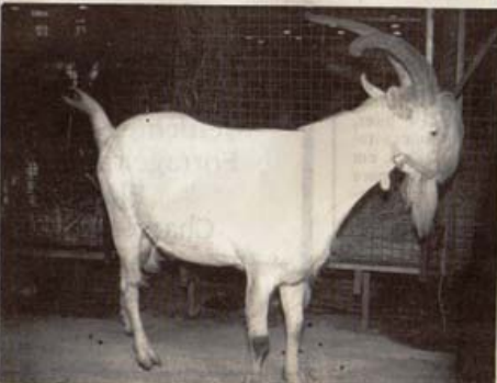
Condor da Serra dos Andradas.

Ele explica que o Brasil tem excelente estoque de matrizes nativas - de qualidade, rusticidade e prolixidades na adaptação às condições locais de alimentação e clima. Isso já propicia início de programa favorável, desde que se defina um plano para selecionar de 2 a 3% desse rebanho para adequá-lo e melhorar uma, capacitação leiteira. Far-se-ia o uso de reprodutores melhoradores e o controle para continuada melhoria de qualificação leiteira.